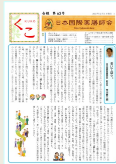
年3回発行の会報「くこ」

今年は設立20周年を迎え、11月23日には記念式典と特別講演会を企画しています。詳しくはホームページをご覧ください。どなたでも参加できます。