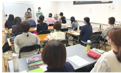
大阪教室・平日コース

4月、全国7か所で、10の教室が一齐に始まりました。今年度は、新たに札幌教室が開設され、大阪教室でも土日コースが増設されました。計172人の新入生が薬膳の専門家を目指して勉学に励んでいます。