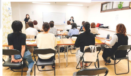
大阪教室・第3土日コース