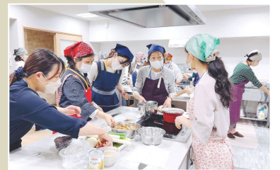
大阪教室・第1土日コース