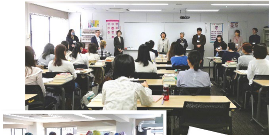
東京校・平日コース