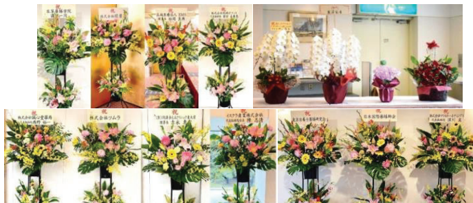
受付ロビーは華やかで同窓会のような賑わい