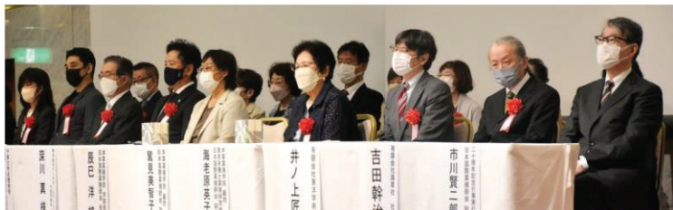
上 感染症対策をとった上での会場の様子 下 ご来賓の皆様